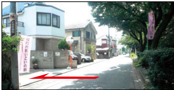
上水桜通り小金井街道側からの景色 両側にピンクの幟旗