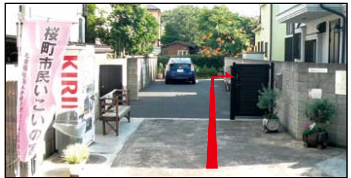
上水桜通りから「いこいの家」入口正面の景色 中で右折