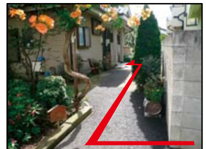
上記を右折した景色 左側が家屋